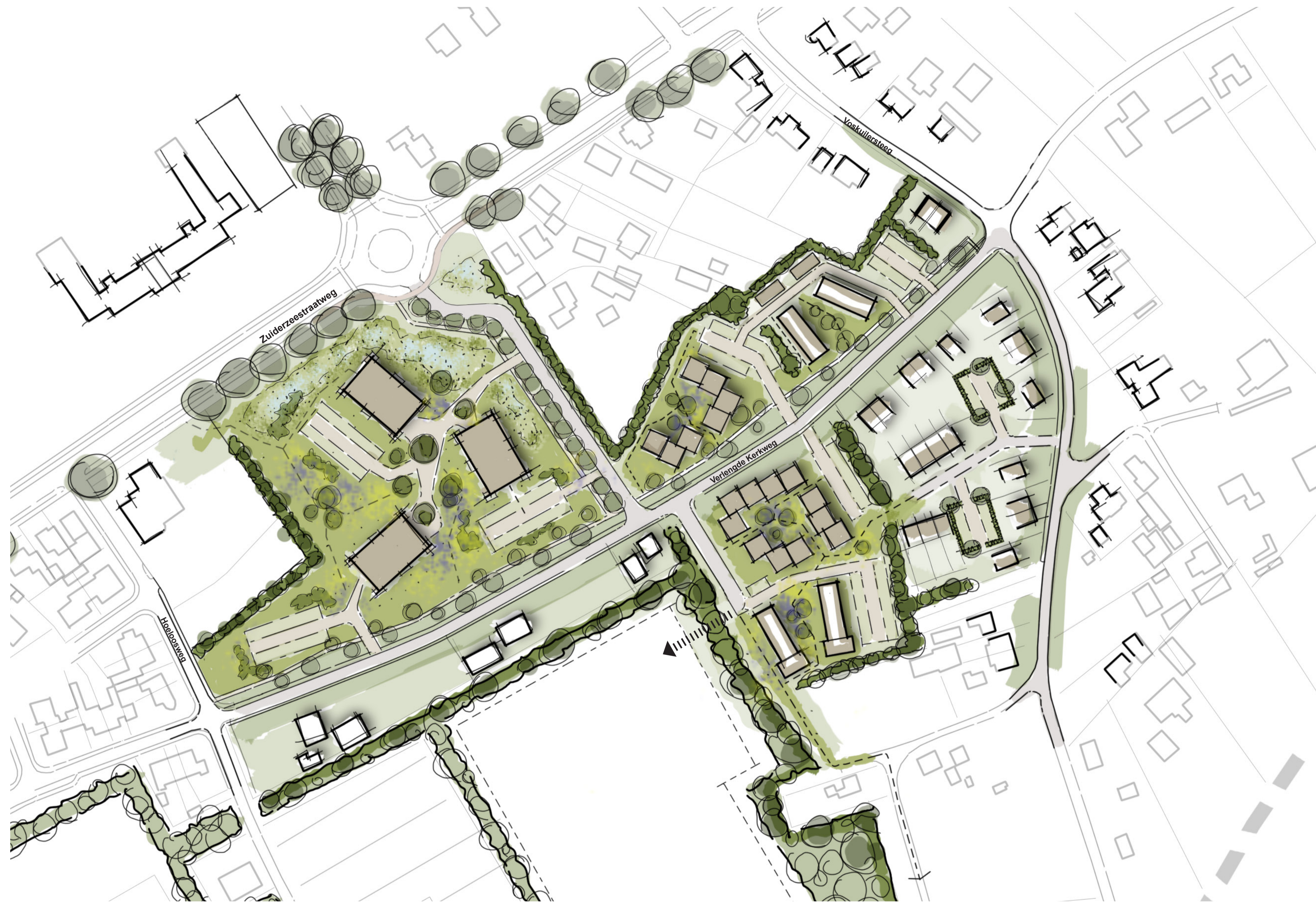
▲ stedenbouwkundige schets, schaal 1 op 1000