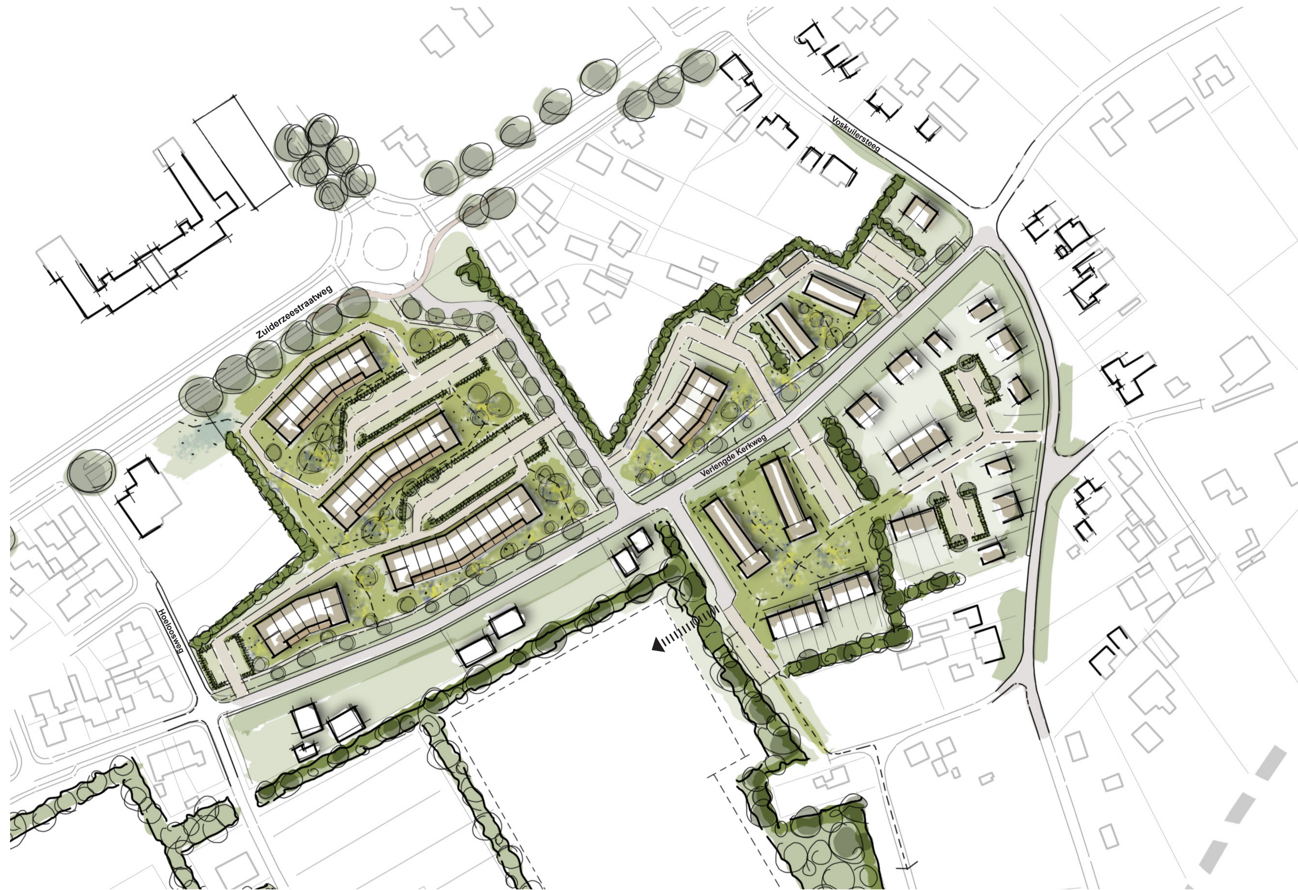
▲ stedenbouwkundige schets, schaal 1 op 1000