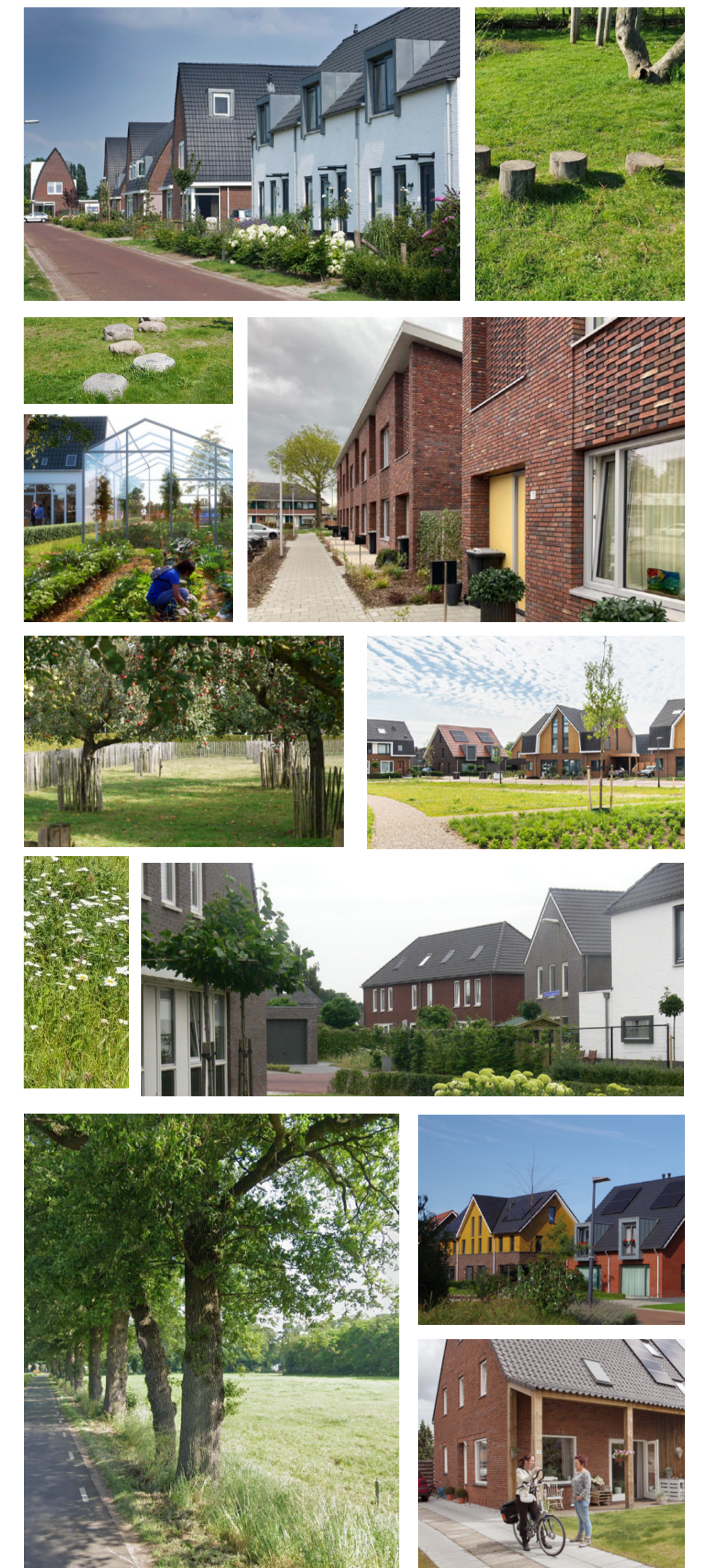
sfeerbeelden woonbuurt ▲