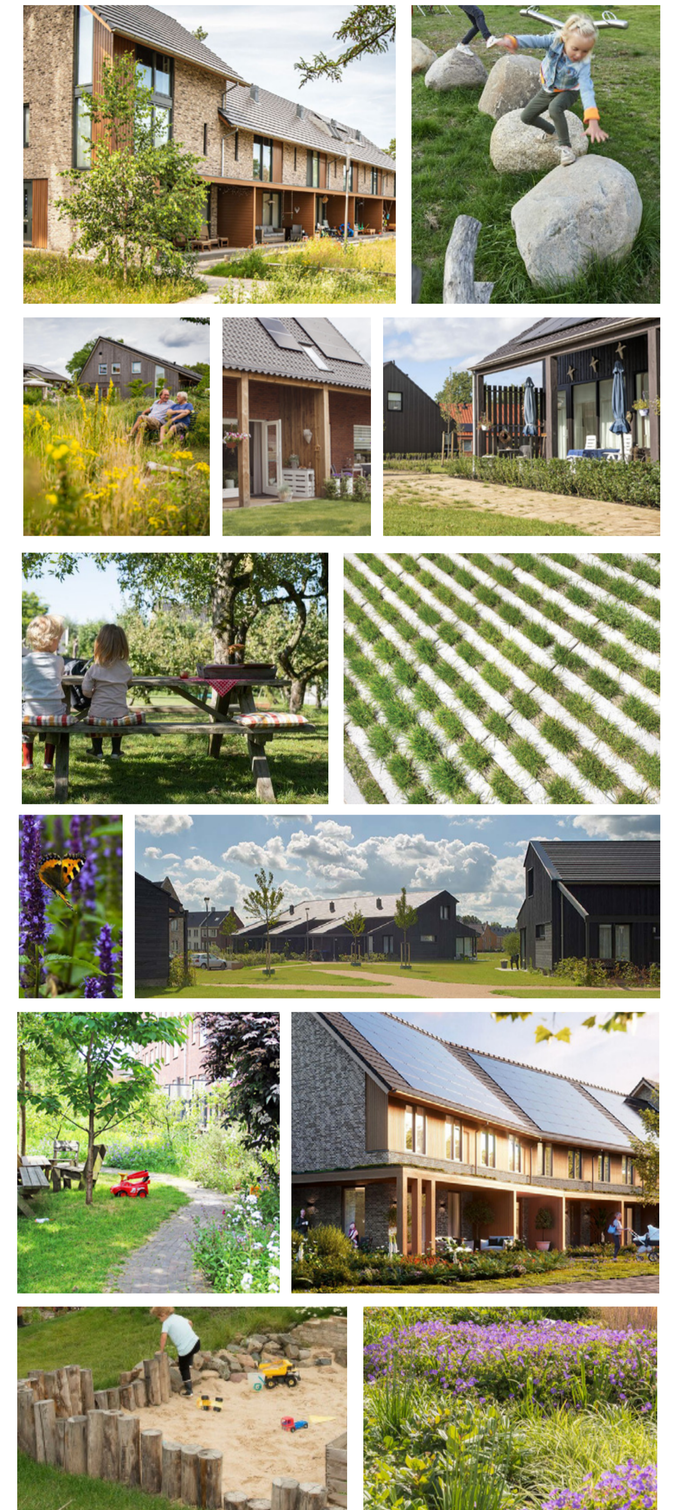
sfeerbeelden woonbuurt ▲